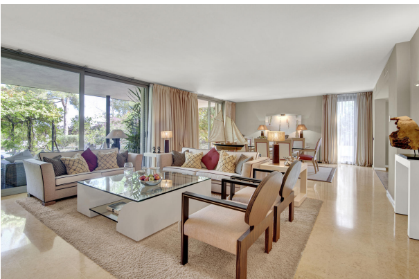
Helles und schönes Wohnzimmer