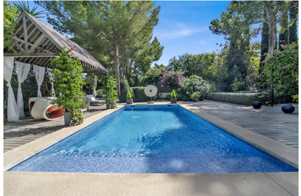
Moderne Villa mit tollem Aussenbereich