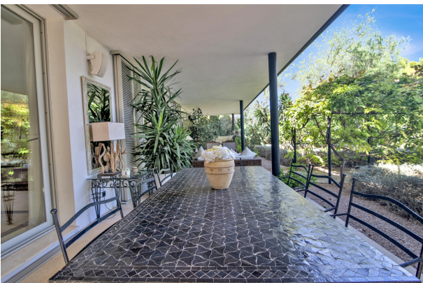
Villa mit Pool