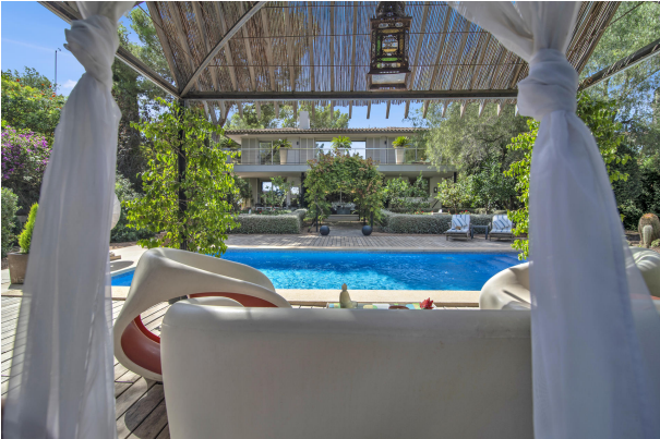
Villa mit schönem Pool