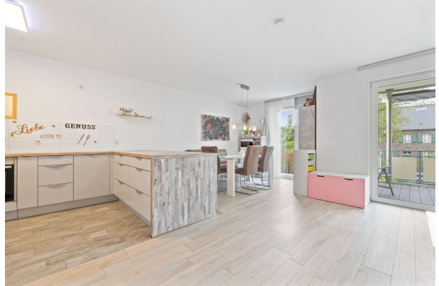
Wohn, Küche & Essbereich