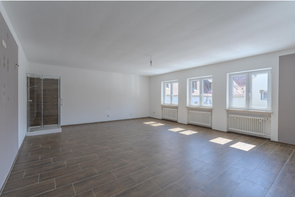
1. OG EZ Wohnung