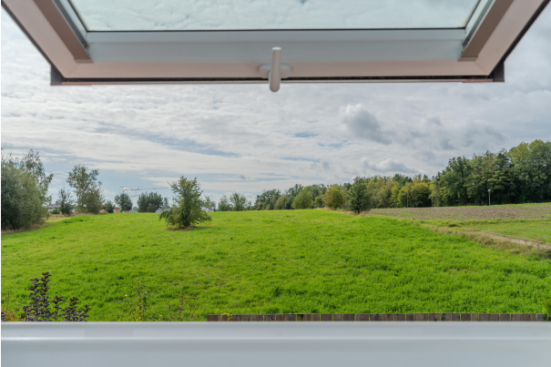
Charmantes Badezimmer im DG!