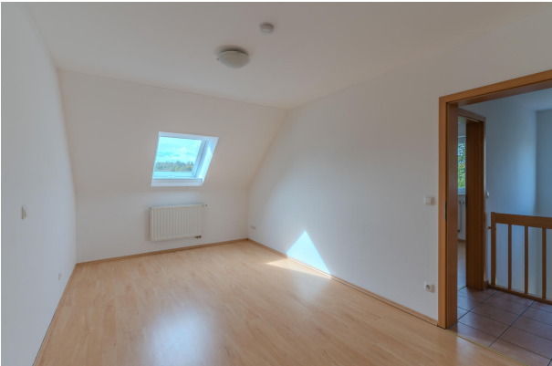
Gemütlich und ruhig!