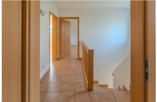
Als Schlafzimmer super geeignet!