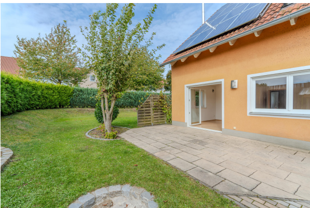
So könnte Ihr neuer Wohnbereich aussehen