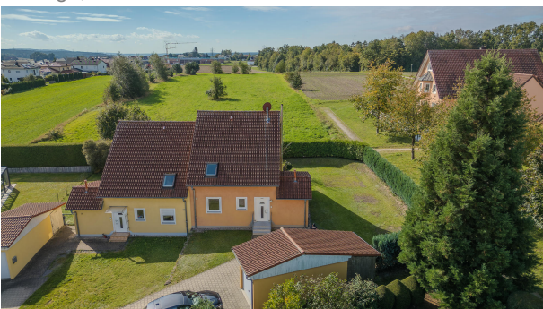
Freundliche Fassade + Außenkamin!