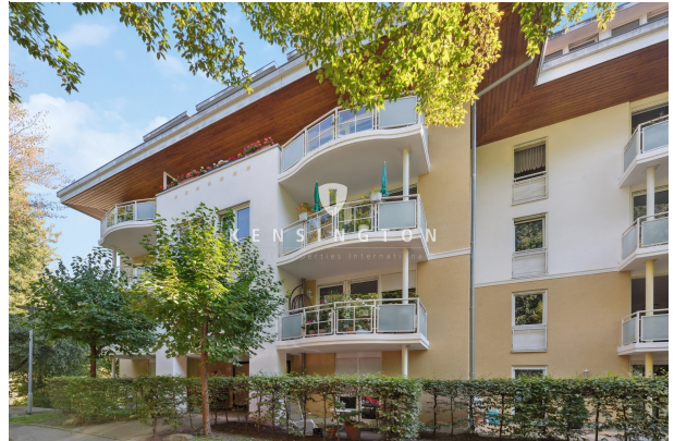
Haus von vorne